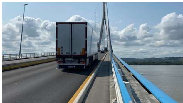
Juillet 2024 : bande d'évitement neutralisée, piétons et cyclistes circulent sur l'espace piéton. Dans le sens le Havre-Caen, les cyclistes ont interdiction de circuler, ils doivent emprunter l'espace piétons, à pied...

C'est raté ! La CCI dit que ce n'est pas de son ressort. Les départements disent ne pouvoir prendre en charge cette navette, la frontière interdépartementale se situant au milieu du pont. Les regards se tournent vers la Région Normandie, en charge du transport non urbain de personnes au niveau régional. Cette dernière argue qu'elle est en charge des liaisons interurbaines, et qu'une navette destinée à un type d'usagers pour traverser la Seine n'entre pas dans ses attributions, qu'il existe une ligne Le Havre-Caen qui passe par le pont de Normandie et que les cyclistes qui le souhaitent peuvent réserver une place, la veille, pour l'emprunter... Certains cyclistes, notamment en groupe, se font refouler lors de la réservation du car Nomad ; d'autres, on les comprend, ne veulent pas traverser le pont à vélo, craignant pour leur sécurité. Seule alternative possible dans ces cas-là : un "petit" détour de... 67 km pour passer d'une rive à l'autre grâce au bac qui relie Quillebeuf à Port-Jérôme-sur-Seine, en empruntant en grande partie l'itinéraire La Seine à Vélo.