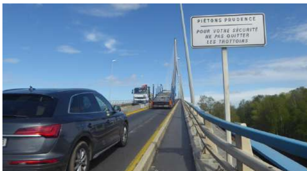
Avril 2024 : bande d'évitement neutralisée, piétons et cyclistes se partagent la bande étroite pour les 2 sens de circulation.